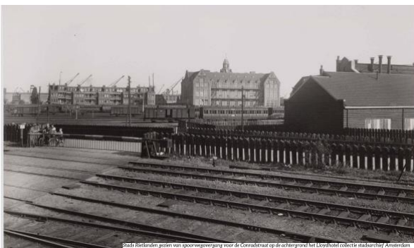
Stads Rietlanden gezien van spoorwegovergang voor de Conradistraat op de achtergrond het Looysbuitel