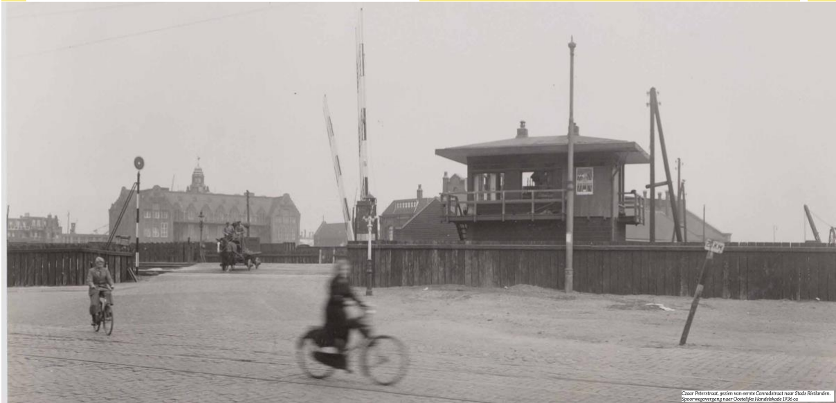
Chaar Petermaat, gezien van eerste Conradistraat naar Stads Rietlanden, spoorwegovergang naar Chotelier (landrijkskade 1936-37)