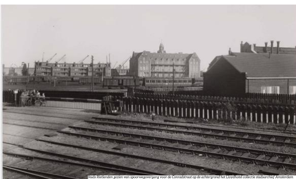
Stads Rietlanden gezien van spoorgang naar de Conradistraat op de achtergrond het Looysbuitel collectie stadarchief Amsterdam