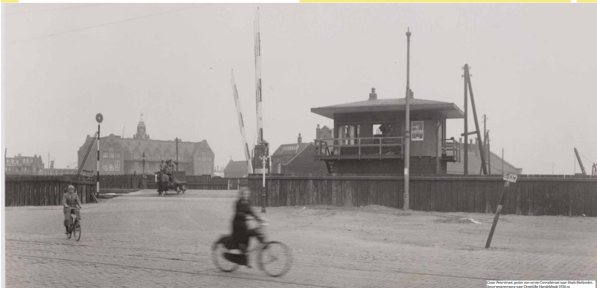
Chaar Petermaat, gezien van eerste Conradistraat naar Stads Rietlanden, spoorgang naar Chastelle (landelijke 1936)